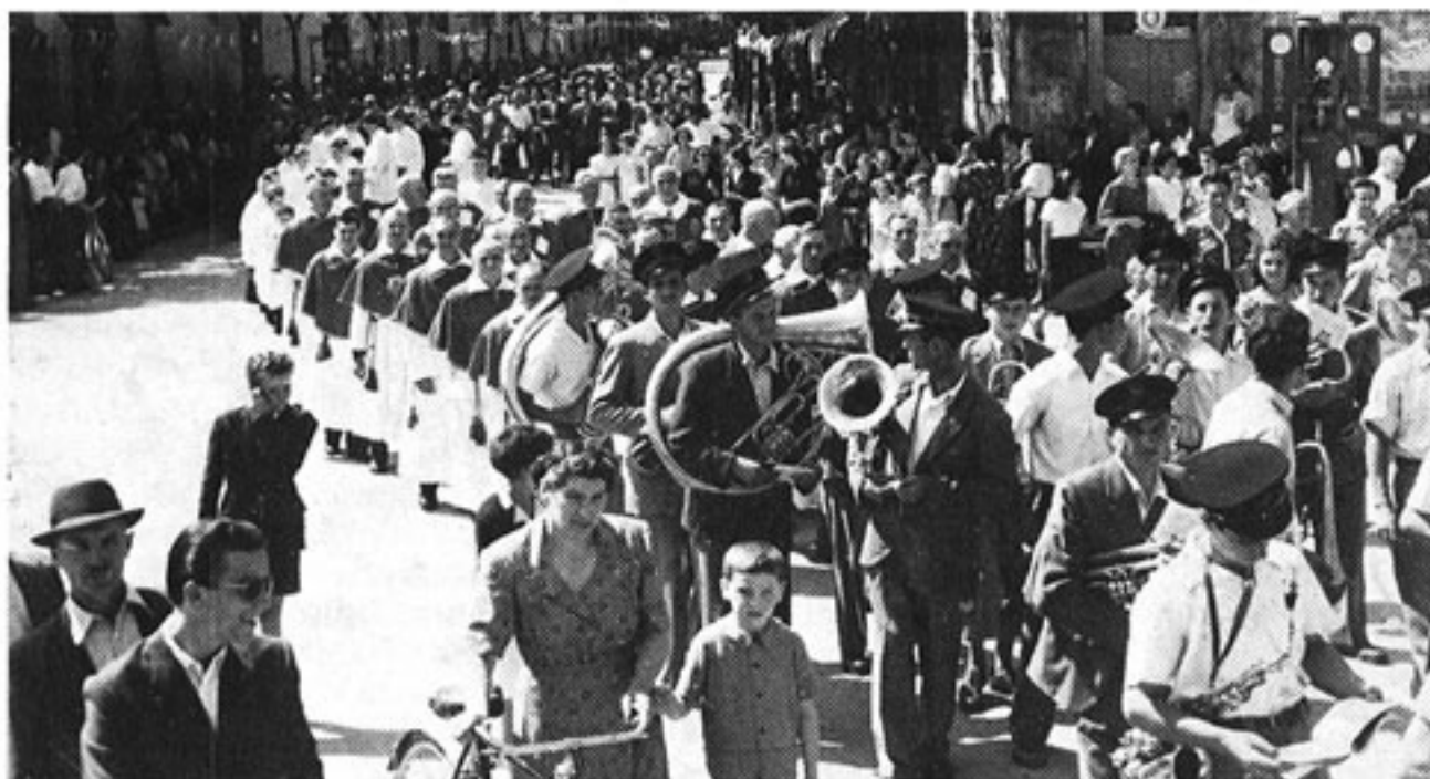
Festa di popolo al ritorno del pastore.