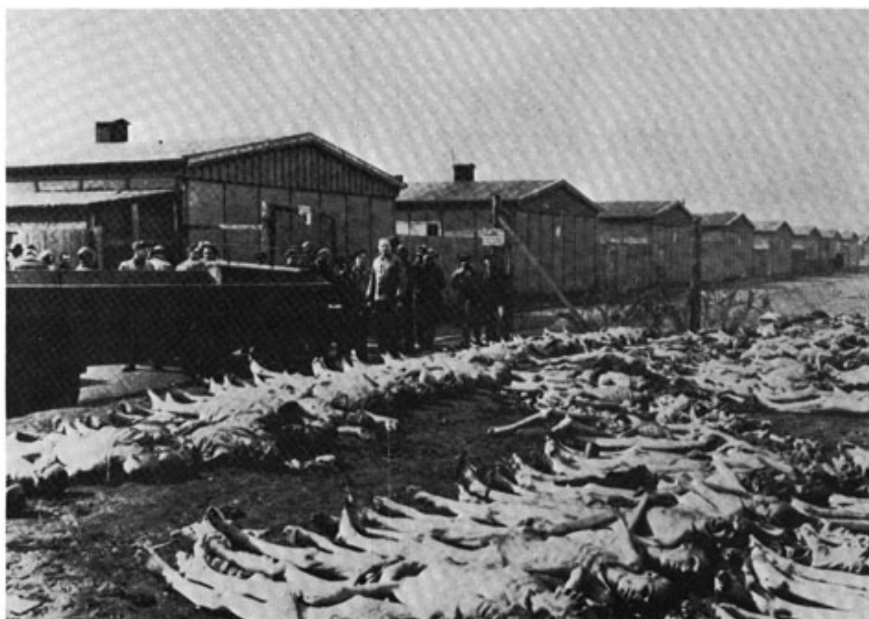
Il campo di sterminio di Dachau.

Quando mi fu detto che c'era l'Arciprete di Soave, cercai di scoprirlo fra quegli uomini magri, ma di alta statura, che si aggiravano parlottando attorno al lungo e stretto cortile della baracca. Mi fu invece presentato un «ometto» con una giacca ed un paio di calzoni che non erano stati certo tagliati sulla sua misura; calzava un paio di zoccoloni di legno che gli permenttevano di muoversi a stento. Quando si presentò era mesta la sua voce e i suoi occhi velati di pianto. Si sentiva strappato dal gregge, il padre tolto alla sua cara famiglia.