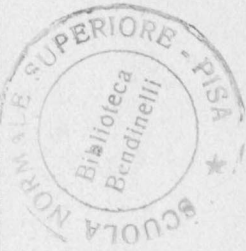
A. MATTIELLI: BOLLE DI SAPONE.