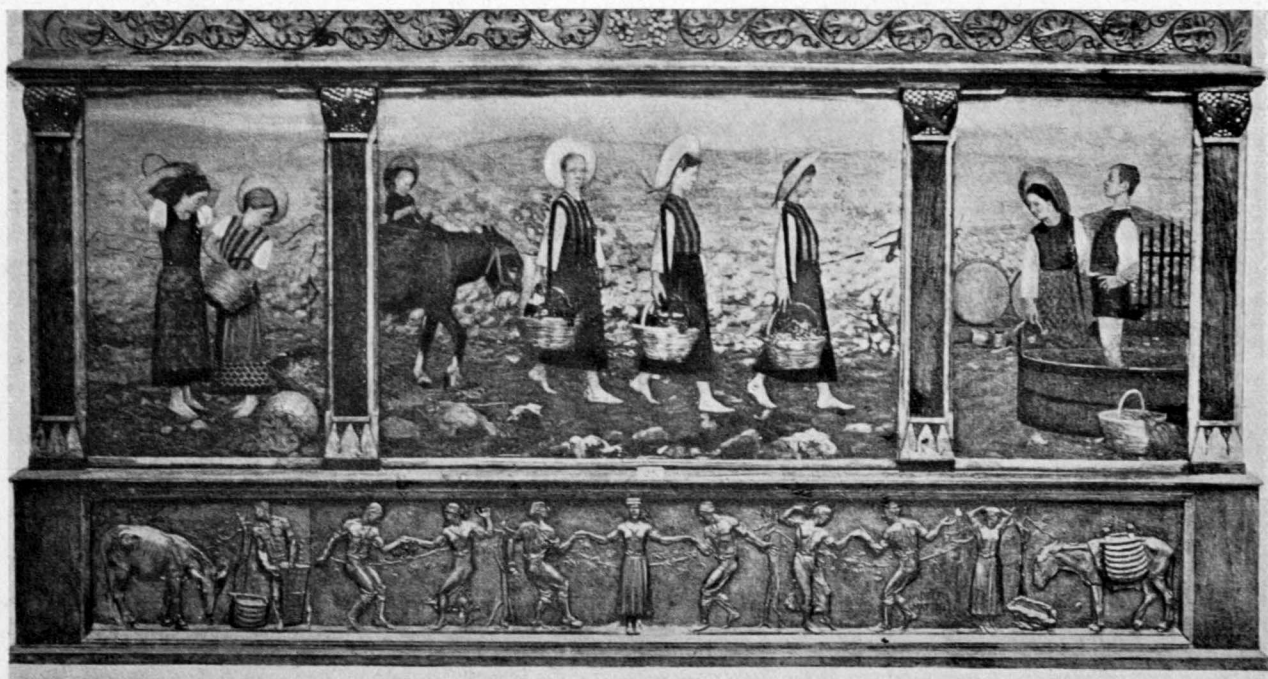
A. MATTIELLI: L'OTTOBRE A SOAVE.