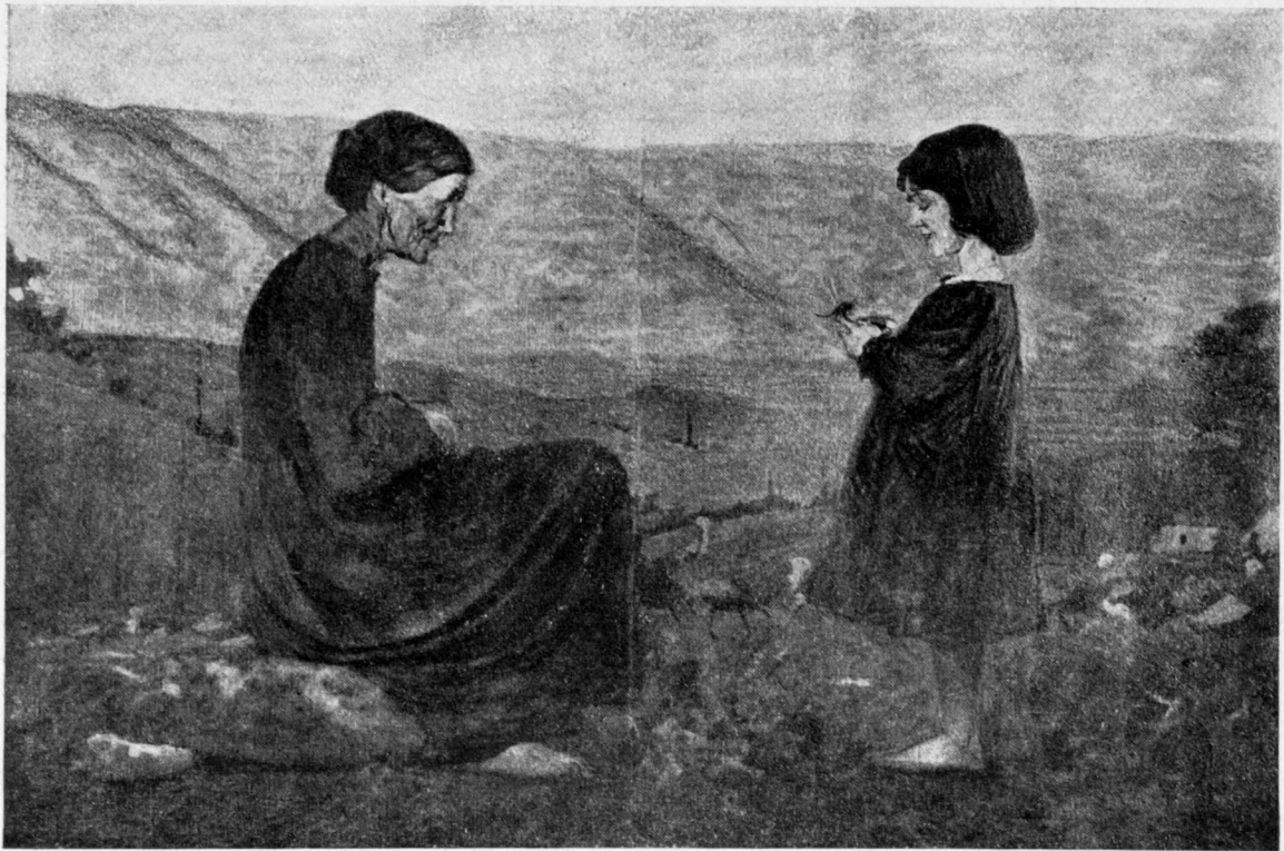
A. MATTIELLI: SANTITÀ DELL'ORA.