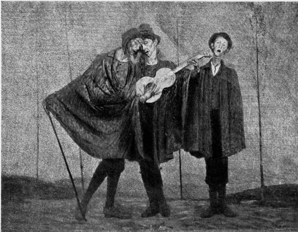
A. MATTIELLI: VAGABONDI.

Questa esatta comprensione degli spiriti « irregolari » dimostra la vasta capacità intellettuale del Mattielli. E se egli si scostasse un giorno dal dolce mondo spirituale che dà la caratte-