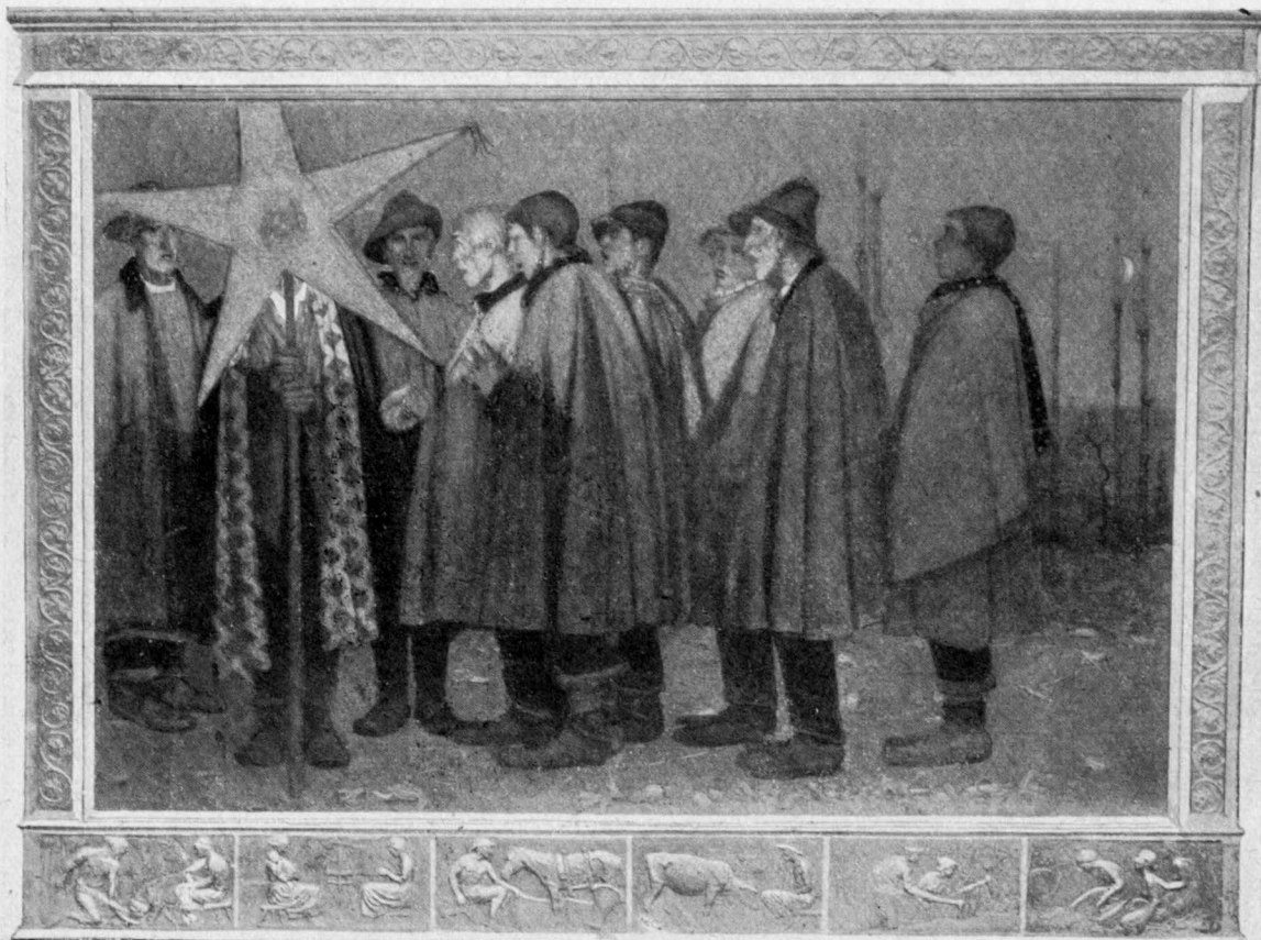
A. MATTIELLI: LA STELLA DI NATALE.

cui le tristezze sono dimenticate, i cattivi sentimenti svaniscono, le altrui malvagità sono perdonate. Tacciono i contrasti nella natura e nelle anime; tutto è armonia: nell'aere palpitante, nell'umile stuolo animale sparso intorno, nell'aspetto angelico della bimba, paga d'una libellula per tesoro, nel senso di vita della vecchia pastora, che molto sa e sente perchè molto ha vissuto. Questa mistica figura, china sul suo spirito e sulle sue memorie, racchiusa in sè e