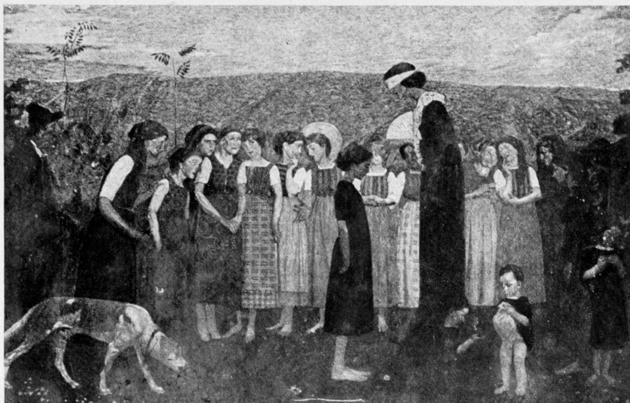
A. MATTIELLI: LA ZINGARA.

Tutta l'arte di Adolfo Mattielli è imbevuta di queste idee; verità, efficacia di persuasione, fa-